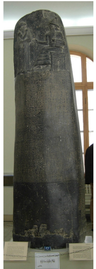
Foto: Stele des Herrschers Hamurapi I, Babylonien, Version Teheran, oben der Herrscher auf seinem Thron als Gesetzgeber, darunter der Codex Hamurapi als Inschrift (ccby 2.0 generic by 31731-Tehran on flickr, Ausschnitt)

Der biblische Schöpfungsbericht interessiert sich mehr für den Sinn und die Würde menschlichen Lebens als für Abstammungsfragen. Die Diskussionen zwischen Kreationisten und Evolutionisten lenken ab vom eigentlichen Hauptpunkt der Schöpfungstheologie. Der biblische Text übernimmt relativ unproblematisch das zu seiner Zeit modernste Weltbild, nämlich die Siebener-Struktur von Himmel und Erde, abgeleitet aus den sieben sichtbaren Gestirnen. Nicht Weltbildfragen sind es, an denen die Bibel Streit anfängt mit der vorherrschenden babylonischen Lehre, sondern die Frage nach der Menschenwürde ist der Explosivstoff, mit dem der biblische Text einen neuen Diskurs eröffnet.